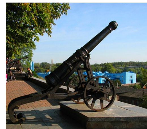
Гармати на Валі

Під час проведення олімпіади для студентів та супроводжуючих осіб буде запропоновано цікаву екскурсійну програму по університету та місту. А в Чернігові є на що подивитись! В'їжджаючи в місто ви відразу потрапляєте “під приціл” старовинних гармат, які розміщені на древньому укріпленому Валі. 12 гармат часів XVII-XVIII сторіч зустрічають кожного, хто в'їжджає до столиці Сіверщини – м. Чернігова.