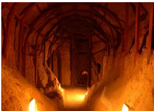
Антонієві печери – XI ст.

В Чернігові розташоване одне з чудес України - стародавні Антонієві печери, які почав створювати ще в XI сторіччі преподобний Антоній Печерський – засновник Києво-Печерської лаври. Під землею розташовані навіть чотири храми, один з яких висотою майже 9 метрів, а в галереях печер, як кажуть, можна зустріти привид монаха!