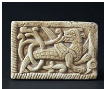
Чернігівський звір – Семаргл.

Кожен бажаючий зможе забрати з собою на згадку про місто сувенір, зроблений руками чернігівських майстрів - різьблені вироби, кераміку, вишиванки, не кажучи вже про традиційні магніти. «Родзинкою» міста є Чернігівський звір – Семаргл, який зустрічається лише в нашому місті – на оздоблених храмах, кованих огорожах, кераміці.