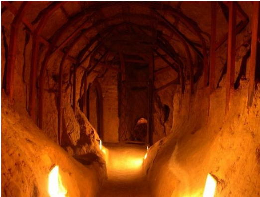
Антонієві печери – XI ст.

В Чернігові розташоване одне з чудес України - стародавні Антонієві печери, які почав створювати ще в XI сторіччі преподобний Антоній Печерський – засновник Києво-Печерської лаври. Під землею розташовані навіть чотири храми, один з яких висотою майже 9 метрів, а в галереях печер, як кажуть, можна зустріти привид монаха!