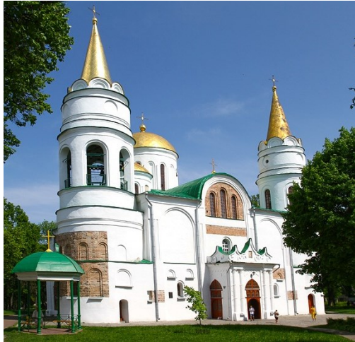
Спасо-преображенський собор – 1034 р.

В Чернігові розташоване одне з чудес України - стародавні Антонієві печери, які почав створювати ще в XI сторіччі преподобний Антоній Печерський – засновник Києво-Печерської лаври. Під землею розташовані навіть чотири храми, один з яких висотою майже 9 метрів, а в галереях печер, як кажуть, можна зустріти привид монаха!