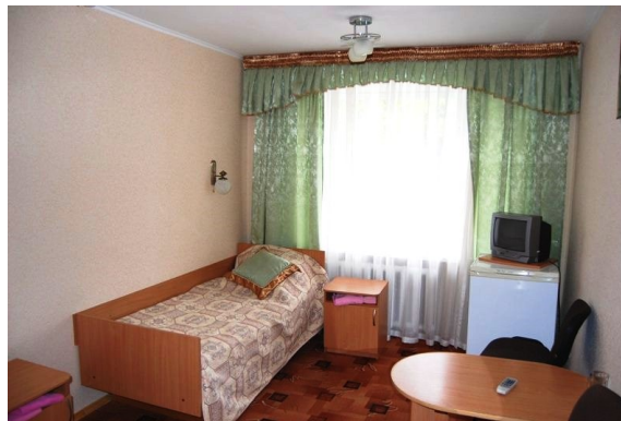
Одномісний номер в готелі.

Участь у конкурсі не потребуватиме значних фінансових витрат, що особливо важливо в наш час. Для проживання кожен зможе знайти для себе найбільш оптимальний варіант. Студенти-учасники конкурсу під час її проведення зможуть оселитись в гуртожитках Чернігівського національного технологічного університету, вартість проживання в яких (близько 50 грн. на добу) буде найбільш прийнятною для них. Вартість обіду в їдальні університету складає біля 30 грн. Для супроводжуваних осіб можна замовити проживання в студентському гуртожитку (для економії коштів), або ж, за бажанням, в одному з декількох готелів, які нададуть більш комфортні умови проживання, і які розташовані зовсім поруч біля головного корпусу університету - в 5 хвилинах пішої ходи. Вартість проживання в готелі є теж невеликою, і складає 150-500 грн. на добу в дво- чи одномісному номері.