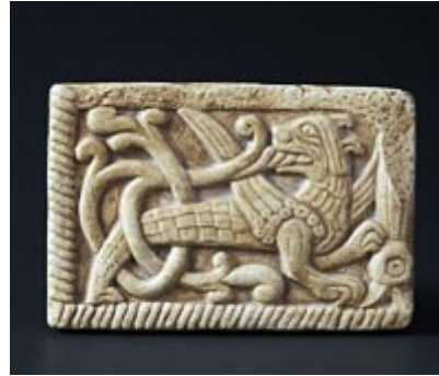
Чернігівський звір – Семаргл.

Кожен бажаючий зможе забрати з собою на згадку про місто сувенір, зроблений руками чернігівських майстрів - різьблені вироби, кераміку, вишиванки, не кажучи вже про традиційні магніти. «Родзинкою» міста є Чернігівський звір – Семаргл, який зустрічається лише в нашому місті – на оздобленні храмів, кованих огорожах, кераміці.