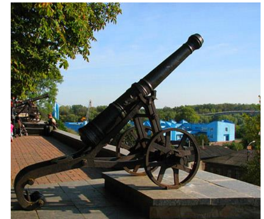
Гармати на Валі

Під час проведення конкурсу для студентів та супроводжуючих осіб буде запропоновано цікаву екскурсійну програму по університету та місту. А в Чернігові є на що подивитись! В'їжджаючи в місто ви відразу потрапляєте «під приціл» старовинних гармат, які розміщені на древньому укріпленому Валі. 12 гармат часів XVII-XVIII сторіч зустрічають кожного, хто в'їжджає до столиці Сіверщини – м. Чернігова.