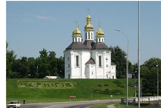
В'їзд в Чернігів – Катерининська церква.

Зручне розташування міста Чернігів в двох годинах їзди на північ від столиці України зробить ваш маршрут до місця проведення конкурсу нескладним з мінімумом пересадок. Рух маршрутних мікроавтобусів, що відправляються з м. Київ кожної півгодини, суттєво спрощує ваш маршрут зі столиці. Прямі потяги зі Львова, Харкова та інших міст України можуть зробити вашу подорож взагалі без пересадок!