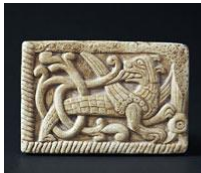
Чернігівський звір – Семаргл.

Кожен бажаючий зможе забрати з собою на згадку про місто сувенір, зроблений руками чернігівських майстрів - різьблені вироби, кераміку, вишиванки, не кажучи вже про традиційні магніти. «Родзинкою» міста є Чернігівський звір – Семаргл, який зустрічається лише в нашому місті – на оздоблених храмах, кованих огорожах, кераміці.